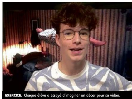
EXERCICE. Chaque élève a essayé d'imaginer un décor pour sa vidéo.

De retour en classe, les élèves ont commenté les prestations : « Tu aurais pu regarder davantage la caméra » ; « Il y a trop de silences et de euh dans ta critique » ; « Tu as bien choisi le tee-shirt ! » ; « Ça donne envie de voir le film ! »